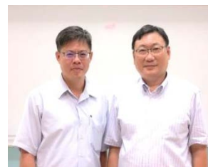
(C) 105 年 10 月 7 日生化所邀請成大生技所 陳宗嶽 特聘教授兼所長來院演講。