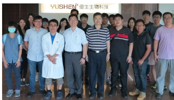
中科園區優生生技公司