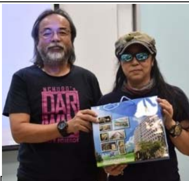
(G) 107 年 10 月 26 日生科系邀請科普作家，金鼎獎得主 張東君 作家 。