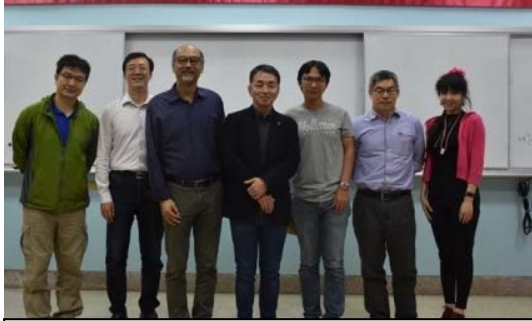
(J) 107年11月30日黃副院長邀請日本東京工業大學 田川陽一教授 。