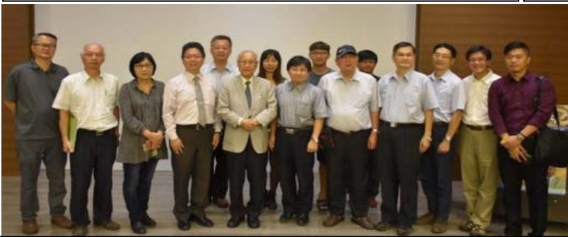
(E) 107 年 10 月 19 日陳院長邀請中研院院士/國立海洋大學 廖一久 院士/終身講座 擔任惠蓀講座。