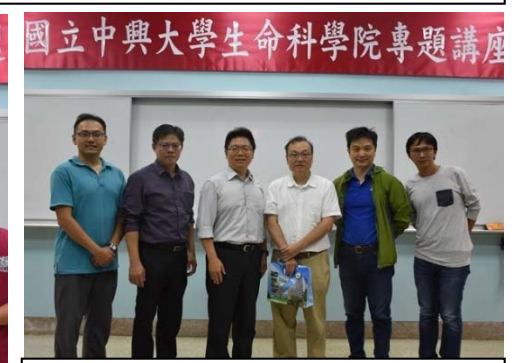
(I) 107 年 11 月 23 日生化所邀請中研院 細胞與個體生物學研究所 郭紘志 研究員 。