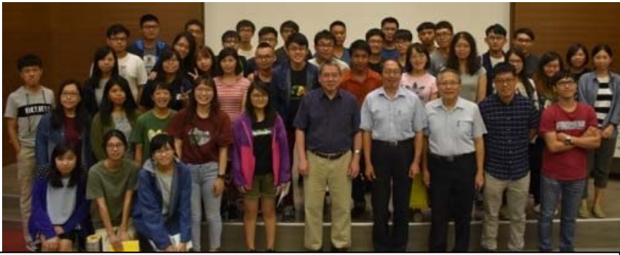
(A) 107 年 9 月 12 日分生所邀請美國賓州州立大學 生物化學與分子生物學 高德輝 院士/傑出教授 。

(2)107 學年度第一學期生科院專題演講共規劃 15 場次，已順利完成 14 場次的國內及國際學者專家到院演講與座談，照片彙集如下