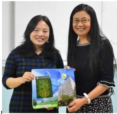
(K) 107年11月30日生醫所邀請清華大學分子與細胞生物所 王慧菁副教授 。