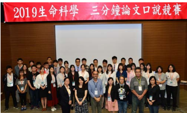
▲2019 生命科學 三分鐘論文口說競賽選手與評審合照