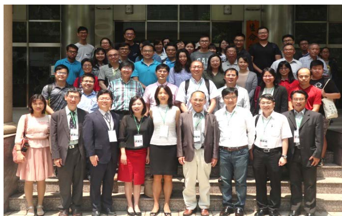
▲4月23日粒線體醫學暨研究研討會合照