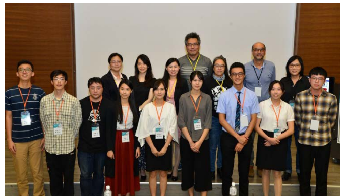
▲9 位初賽優選人員與評審、師長合照