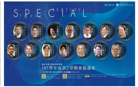
107 學年度第二學期專題演講

(2) 分生所主辦第十六屆台灣質譜學會年會 108 年 7 月 3 日至 5 日順利舉辦。