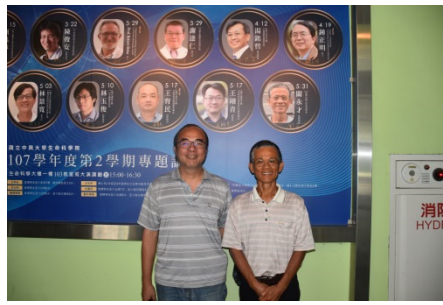
關永才特聘教授(右)