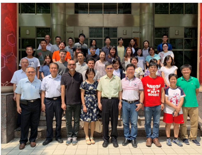
▲院碩士在職專班師生合照。