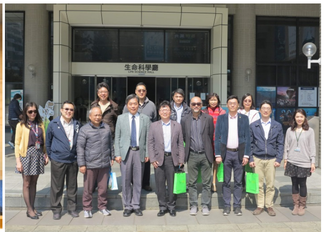
▲生科院主管及同仁拜會科博館孫維新館長

(6) 主管會議 ：109 年 2 月 20 日順利召開 108 學年第 6 次會議，通過第三週期系所評鑑作業進度查核、2020 年生科三分鐘論文競賽籌備、研提生命科學研究推動中心委託執行「推動高中生物自主學習計畫」、修正本院緊急聯絡網規定、修正國立中興大學生命科學院共用場地使用管理辦法部分條文、建請本院購置次氯酸水製造機乙台供各單位防疫之用等 6 案。