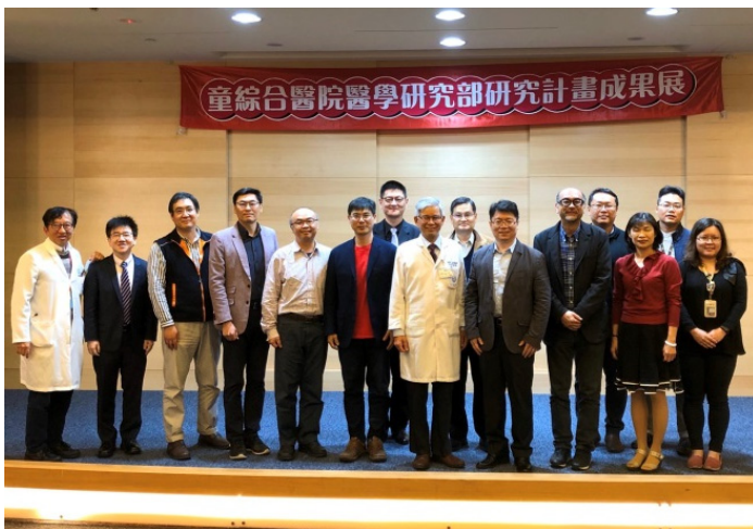
▲童興醫學發展委員會研究計畫成果展