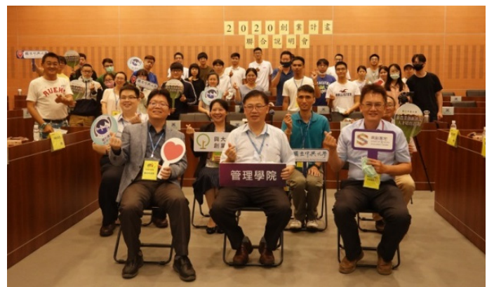
▲ 2020 年創業計畫聯合說明會

(7) 109 年 5 月 19 日生命科學院與各單位聯合主辦「 2020 年創業計畫聯合說明會 」，提供有興趣學生校內創新創業之管道。