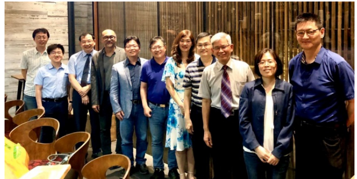
▲ 第二季童興執委會

(2) 109 年 5 月 6 日召開 109 年 第二季童興執委會 會議完竣。