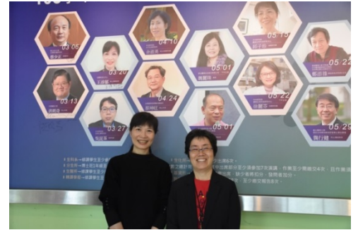
王淳郁博士專案經理(左)