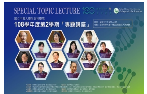
108 學年第二學期生科院專題演講

(4) 109 年 7 月 10 日全球變遷生物學研究中心建立 FACEBOOK 社團專頁，歡迎有興趣者加入。