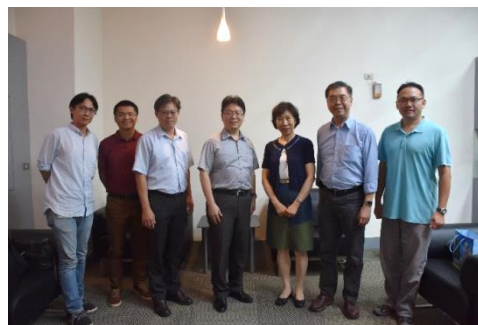
余淑美院士/特聘研究員(右三)