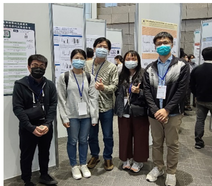
▲分生所業頌銘老師帶領實驗室學生參加活動。