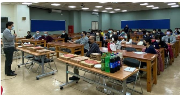
▲生科院碩士在職專班學師生座談