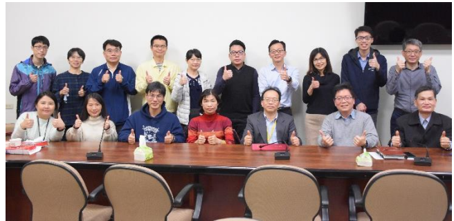
▲轉譯醫學博士學程導生聚