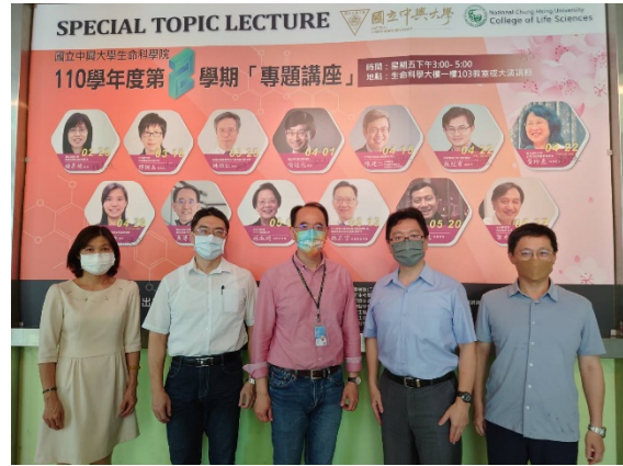
▲111年4月29日惠蓀講座 國立自然科學博物館焦傳金館長(中)