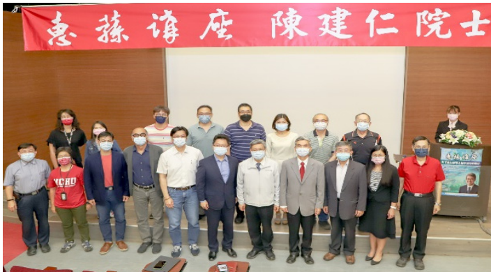
▲ 111 年 4 月 15 日惠蓀講座 前副總統陳建仁院士(前排右五)