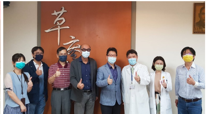
▲ 草屯療養院學術交流