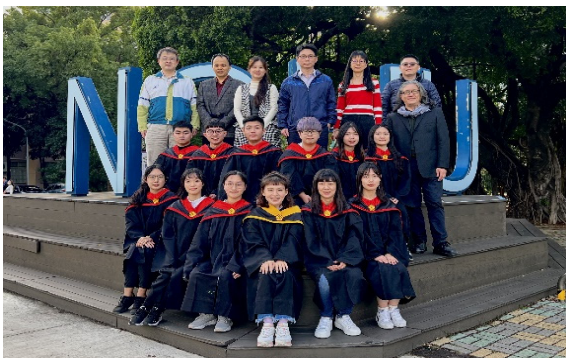
▲基因體暨生物資訊學研究所