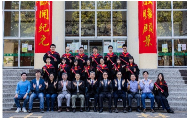
▲分子生物學研究所