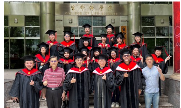
▲生命科學院碩士在職專班